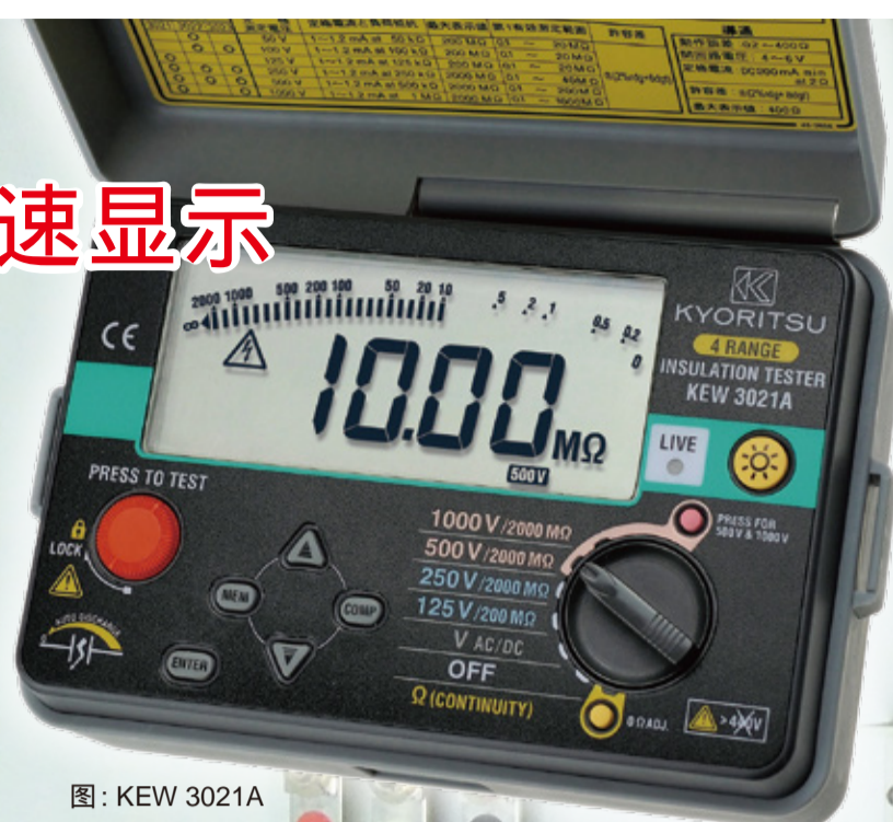
图: KEW 3021A