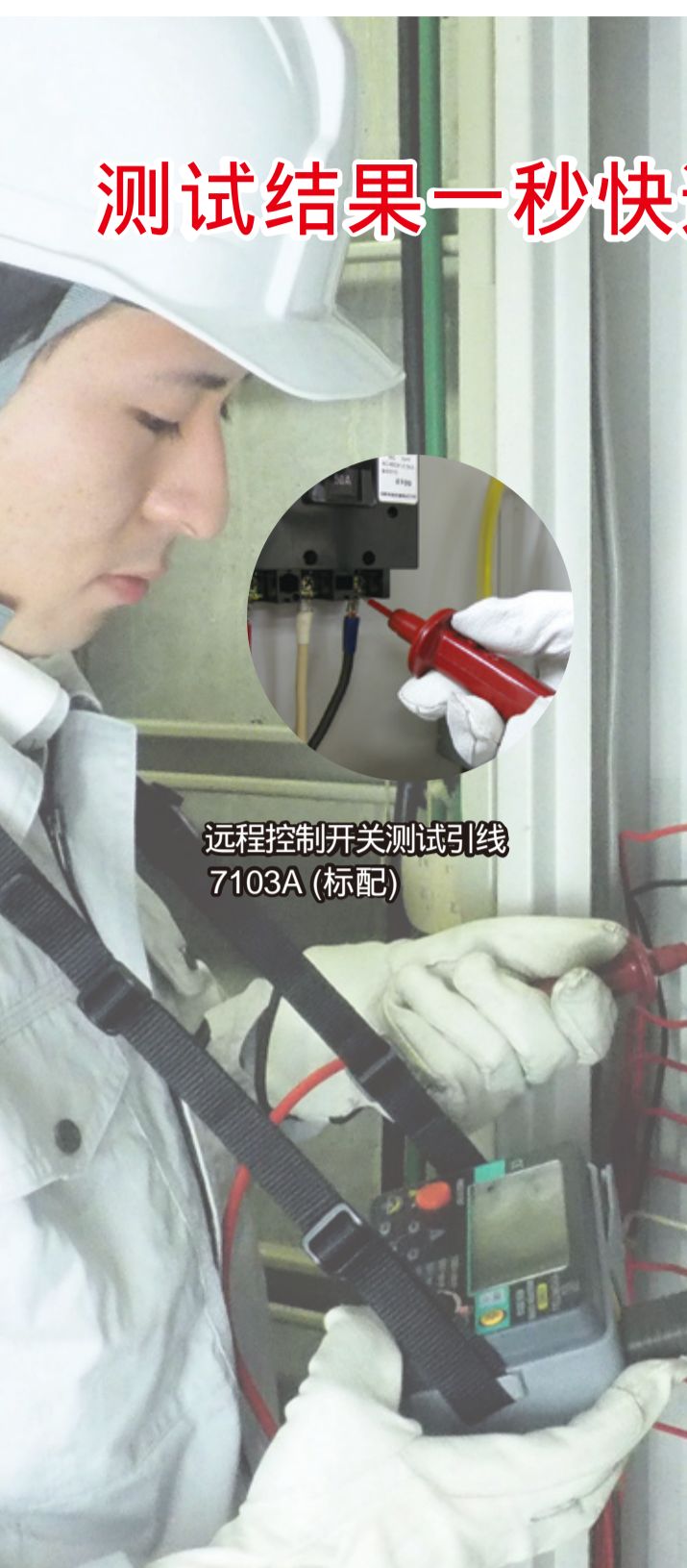
远程控制开关测试引线 7103A (标配)